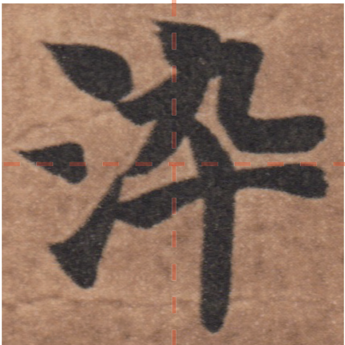
※染字を染としたのは他に例を見ない。 また染と染では韻も違う。 ただし染には染まるという意味もある。